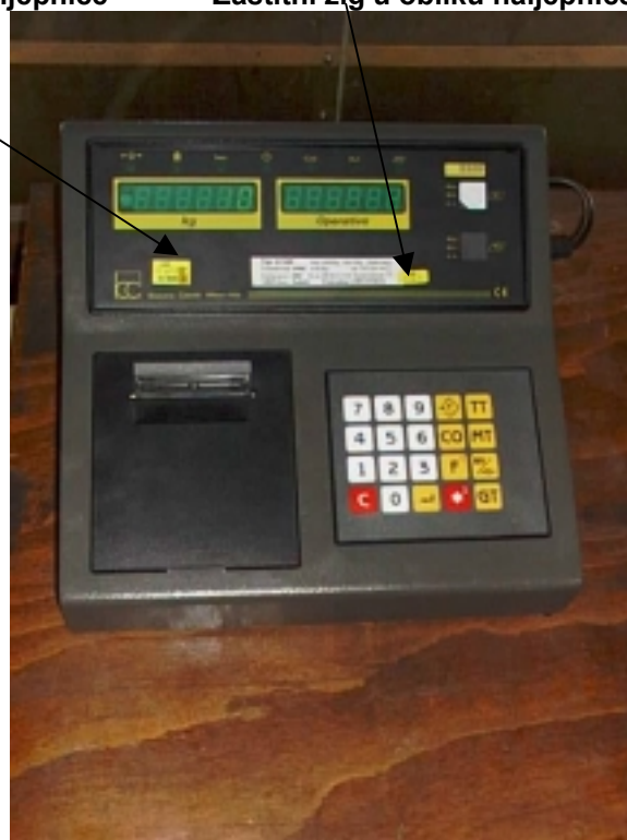
EPU S 320